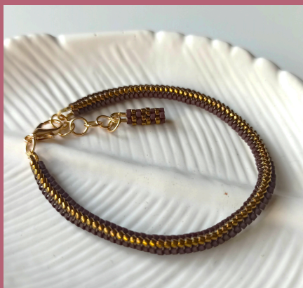
bransoletka (tubular herringbone)