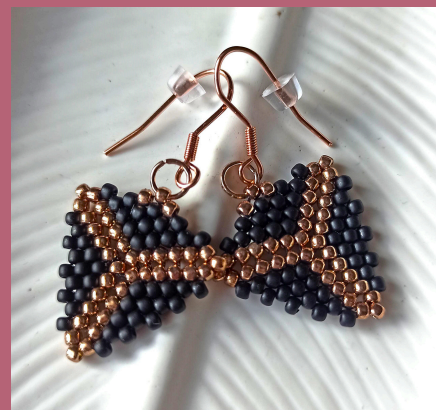
trójkątny wisiołek lub kolczyki (peyote geometryczny)