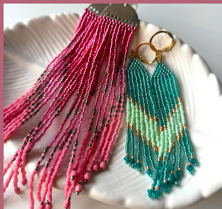
kolczyki "indiańskie" (brick stitch)

Dla osób średnio zaawansowanych , czyli takich, które już wcześniej miały do czynienia z koralikami i coś tam już robiły mam propozycję odrobinę trudniejszych prac: