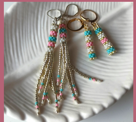
kolczyki-tulejki z frędzlami lub bez

Są to projekty tak przygotowane, by osoby, które dotąd nie zajmowały się beadingiem mogły poradzić sobie z wykonaniem tej biżuterii na jednych zajęciach. Nie trzeba mieć jakichś szczególnych predyspozycji, by wziąć udział, jednak miło będzie jeśli uczestniczka radzi sobie z nawlekaniem igły 😊 bo będzie to czynność wielokrotna.