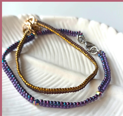
cieniutka bransoletka (herringbone)