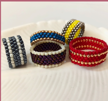
prosta obrączka (peyote parzysty)

Do wyboru mam 3 projekty dla całkowicie początkujących :